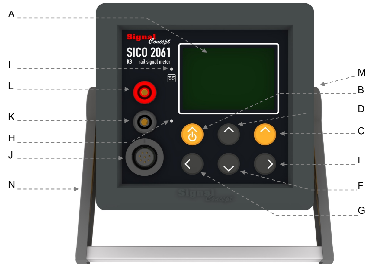
Fig. 2.1 Elementos de mando y conexiones